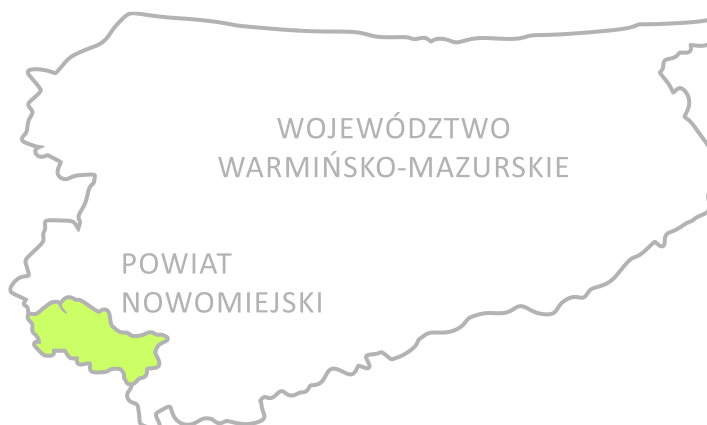
Ryc. 1. Powiat nowomiejski na tle województwa warmińsko-mazurskiego

Wprawdzie historycznie teren ten pokrywa się w dużej mierze z obszarem ziemi lubawskiej, lecz geograficznie przynależy do wielu krain, położony jest na ich styku. Według podziału Polski na krainy fizyczno-geograficzne leży na pograniczu czterech jednostek: Pojezierza Chełmińskiego, Pojezierza Iławskiego, Garbu Lubawskiego i Pojezierza Dobrzyńskiego