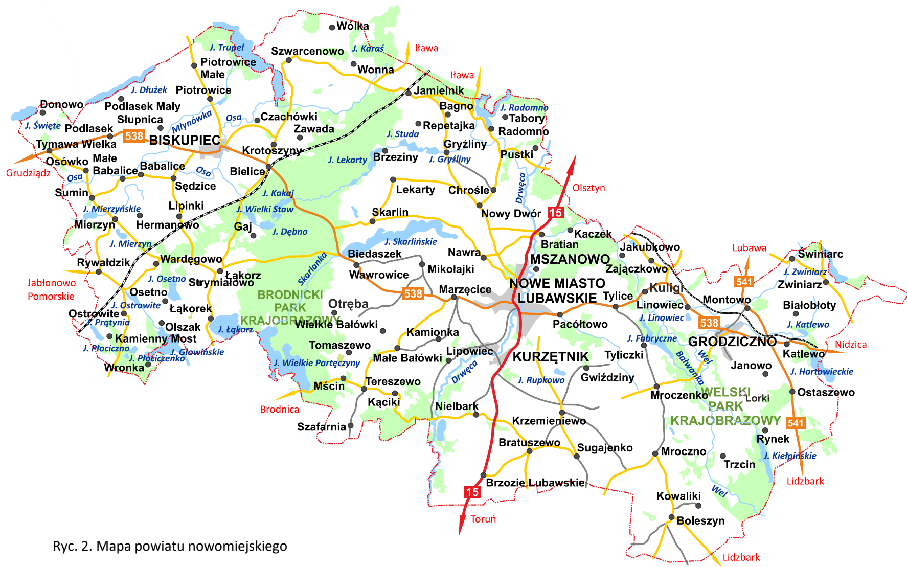
Ryc. 2. Mapa powiatu nowomiejskiego