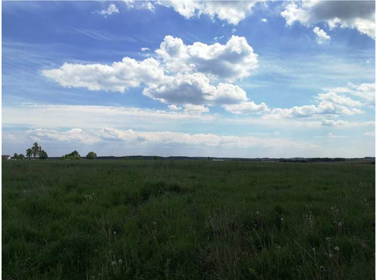
Zdjęcie 1. Roślinność na obszarze objętym planem.