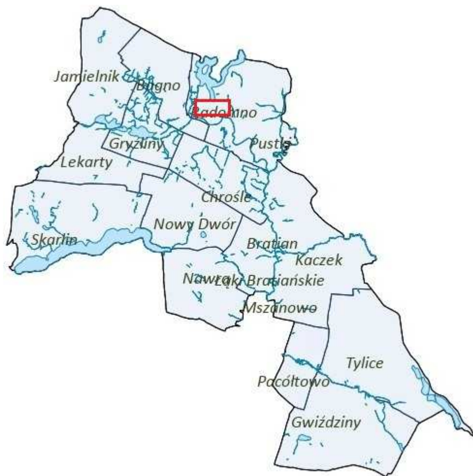
Rysunek 2. Orientacyjna lokalizacja obszaru objętego planem.