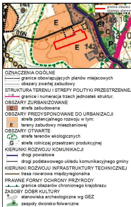
Rysunek 1. Wyrys ze Studium uwarunkowań i kierunków zagospodarowania przestrzennego gminy Nowe Miasto Lubawskie