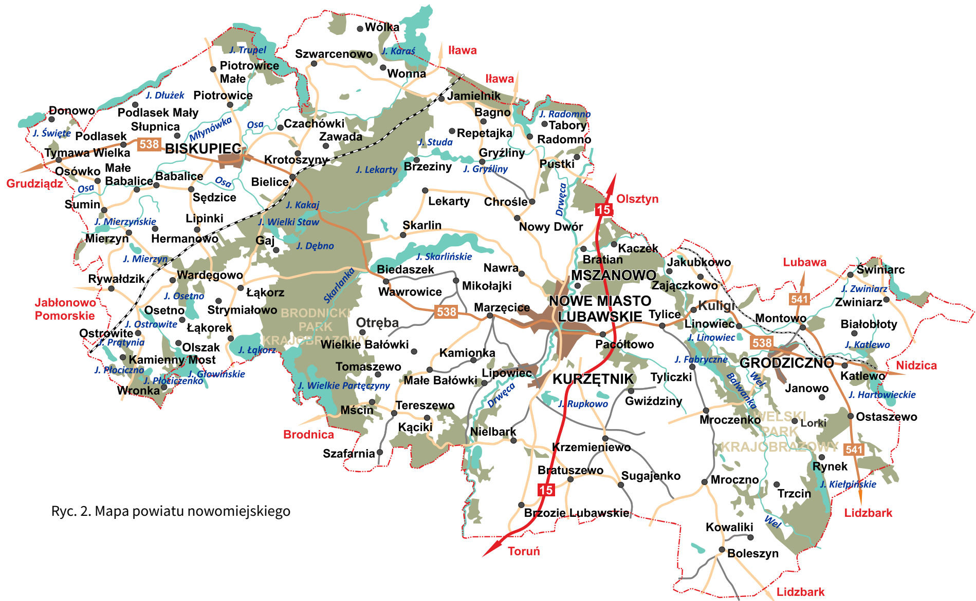
Ryc. 2. Mapa powiatu nowomiejskiego