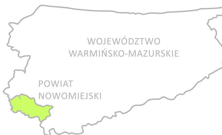
Ryc. 1. Powiat nowomiejski na tle województwa warmińsko-mazurskiego

Powiat nowomiejski położony jest w południowo-zachodniej części województwa warmińsko - mazurskiego i obejmuje miasto Nowe Miasto Lubawskie oraz cztery gminy wiejskie: Biskupiec, Grodziczno, Kurzętnik i Nowe Miasto Lubawskie. Wprawdzie historycznie teren ten pokrywa się w dużej mierze z obszarem ziemi lubawskiej, lecz geograficznie przynależy do wielu krain, położony jest na ich styku. Według podziału Polski na krainy fizyczno-geograficzne leży na pograniczu czterech jednostek: Pojezierza Chełmińskiego, Pojezierza Ławskiego, Garbu Lubawskiego i Pojezierza Dobrzyńskiego. Rzeźba terenu jest bardzo zróżnicowana, dominuje krajobraz pagórkowaty, poprzecinany dolinami rzecznyymi, rynnami i nieckami jezior, terenami podmokłymi.