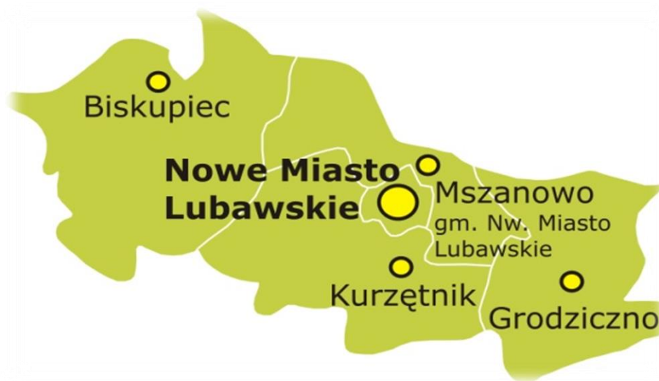
Mapa 2. Mapa administracyjna powiatu nowomiejskiego