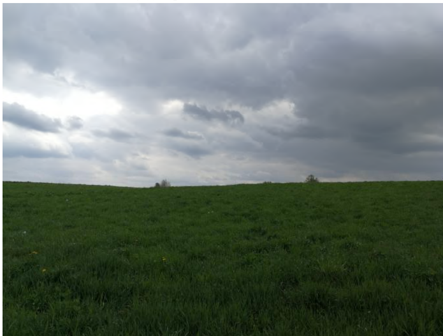
Zdjęcie 1. Roślinność na obszarze objętym planem.