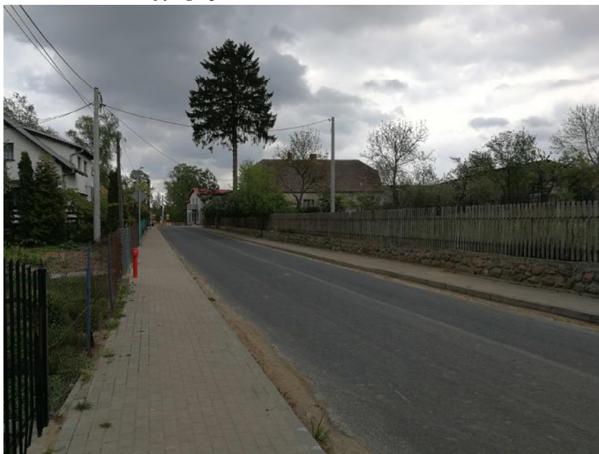
Zdjęcie 2. Sąsiedztwo obszaru objętego planem.

W rejonie obszaru opracowania występuje zabudowa zagrodowa oraz zabudowa mieszkaniowa jednorodzinna.