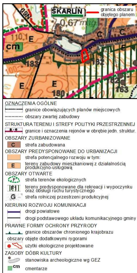
Rysunek 1. Wyrys ze Studium uwarunkowań i kierunków zagospodarowania przestrzennego gminy Nowe Miasto Lubawskie