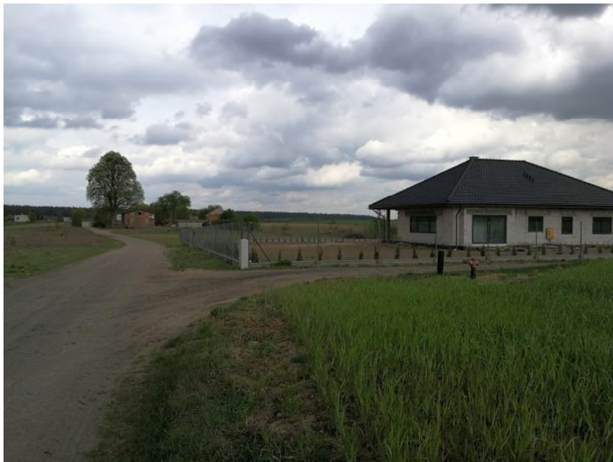
Zdjęcie 2. Sąsiedztwo obszaru objętego planem.

W rejonie obszaru opracowania dominuje krajobraz rolniczy, na który składają się tereny otwarte upraw rolnych oraz niska zabudowa zagrodowa, położona wzdłuż dróg. Jest to krajobraz słabo przekształcony.