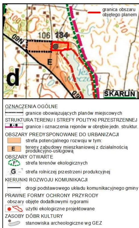
Rysunek 1. Wyrys ze Studium uwarunkowań i kierunków zagospodarowania przestrzennego gminy Nowe Miasto Lubawskie