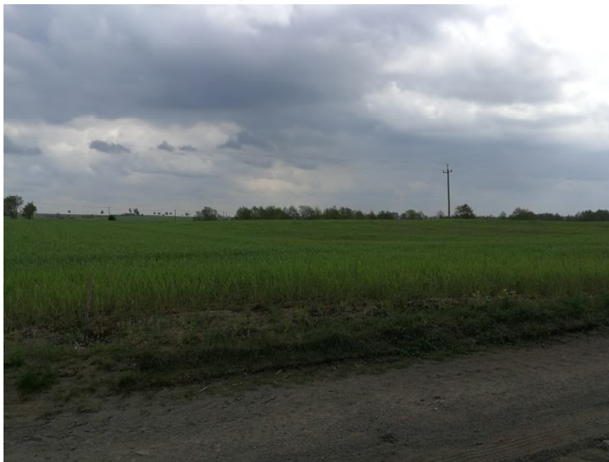
Zdjęcie 1. Roślinność na obszarze objętym planem.