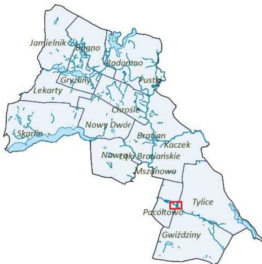
Rysunek 2. Orientacyjna lokalizacja obszaru objętego planem.