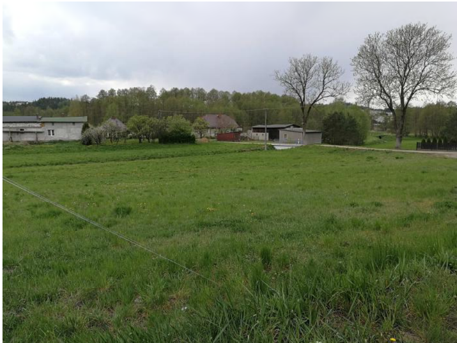
Zdjęcie 1. Roślinność na obszarze objętym planem.