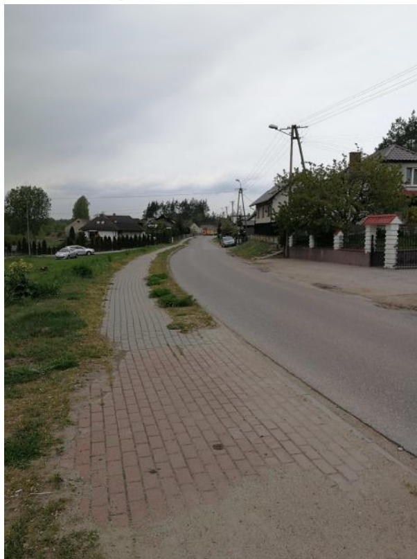
Zdjęcie 2. Sąsiedztwo obszaru objętego planem.

W rejonie obszaru opracowania dominuje krajobraz podmiejski. W najbliższym sąsiedztwie obszaru objętego planem występuje zabudowa mieszkaniowa jednorodzinna.