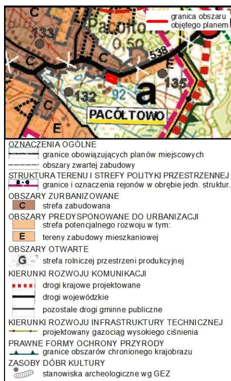
Rysunek 1. Wyrys ze Studium uwarunkowań i kierunków zagospodarowania przestrzennego gminy Nowe Miasto Lubawskie