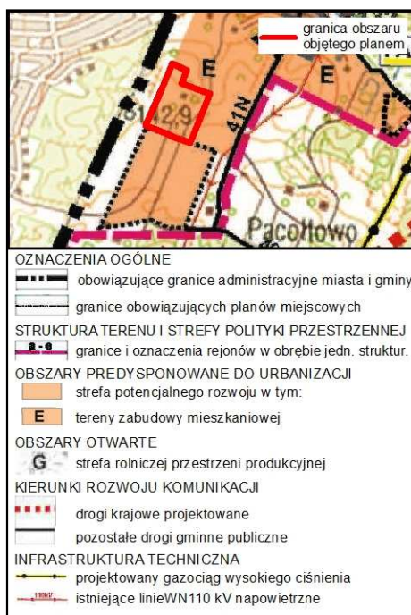
Rysunek 1. Wyrys ze Studium uwarunkowań i kierunków zagospodarowania przestrzennego gminy Nowe Miasto Lubawskie