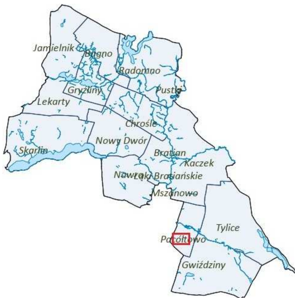
Rysunek 2. Orientacyjna lokalizacja obszaru objętego planem.