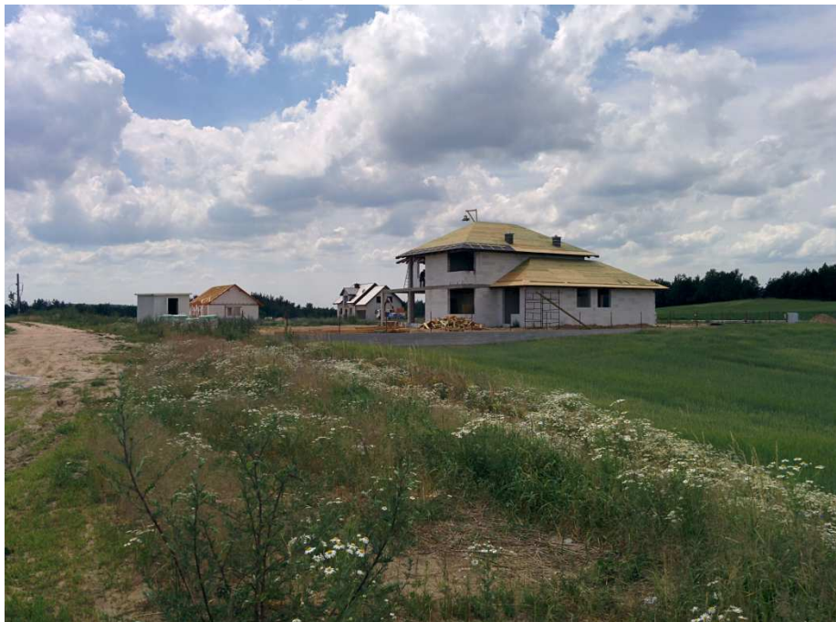
Zdjęcie 2. Sąsiedztwo obszaru objętego planem.

W rejonie obszaru opracowania dominuje krajobraz rolniczy, na który składają się tereny otwarte upraw rolnych oraz istniejąca zabudowa zagrodowa. Jest to krajobraz słabo przekształcony. W sąsiedztwie realizowana jest zabudowa mieszkaniowa jednorodzinna.