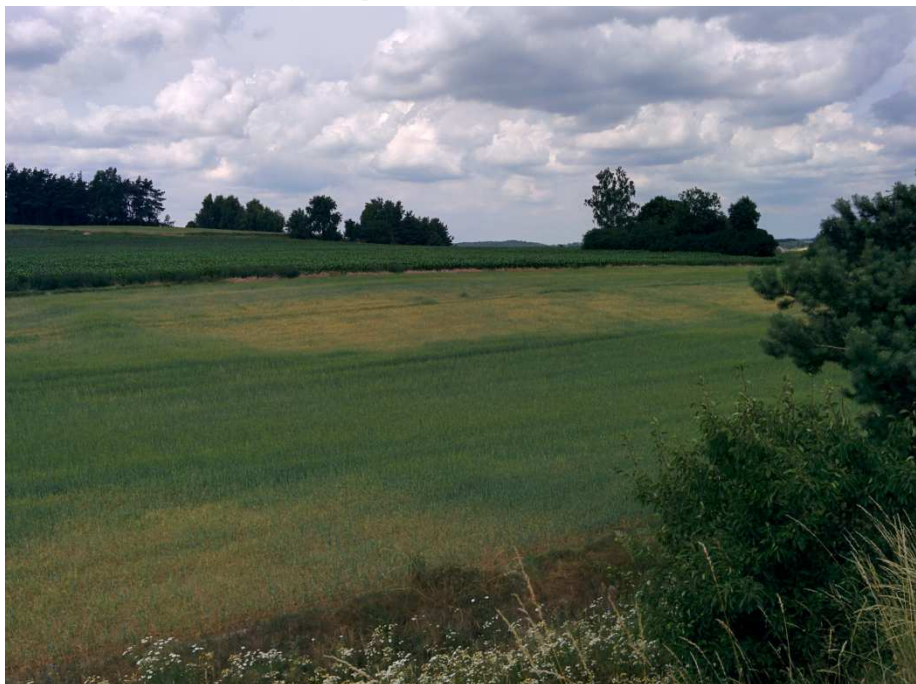
Zdjęcie 1. Roślinność na obszarze objętym planem.