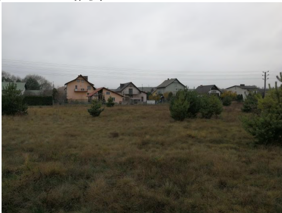
Zdjęcie 2. Sąsiedztwo obszaru objętego planem.

W rejonie obszaru opracowania dominuje krajobraz podmiejski. W najbliższym sąsiedztwie obszaru objętego planem występuje zabudowa mieszkaniowa jednorodzinna