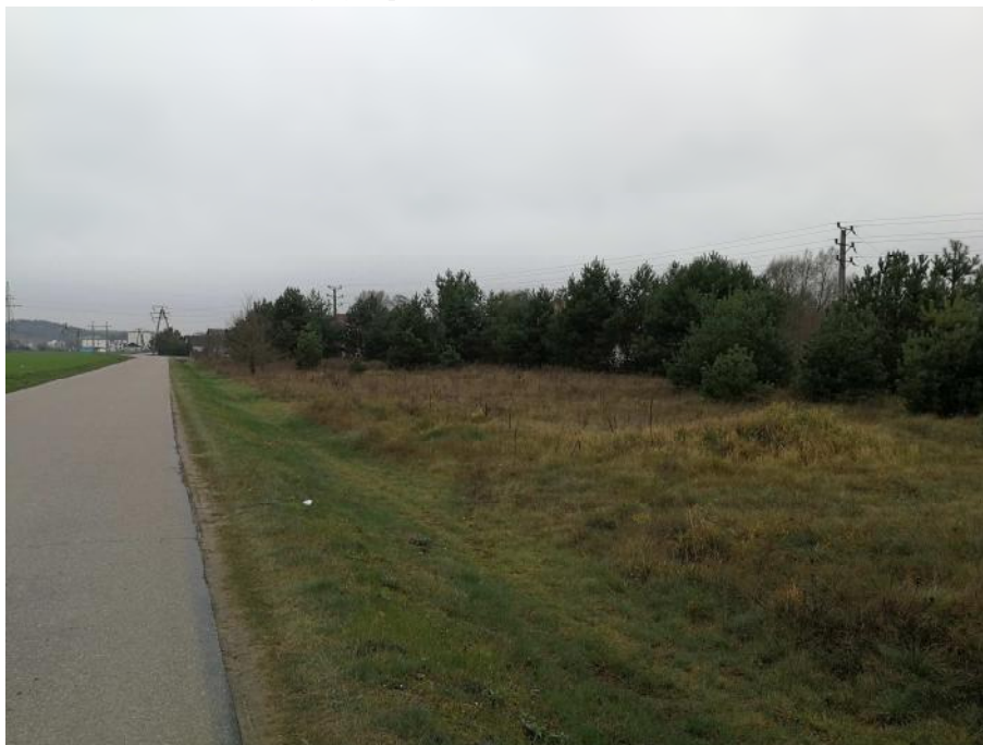
Zdjęcie 1. Roślinność na obszarze objętym planem.