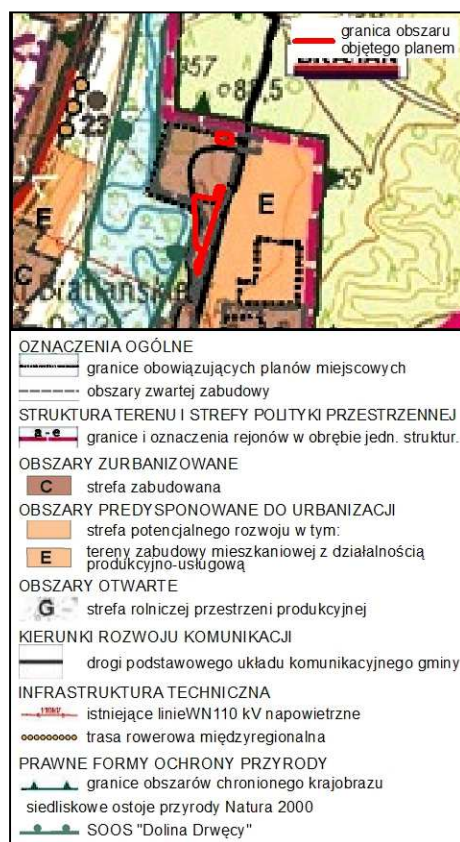
Rysunek 1. Wyrys ze Studium uwarunkowań i kierunków zagospodarowania przestrzennego gminy Nowe Miasto Lubawskie