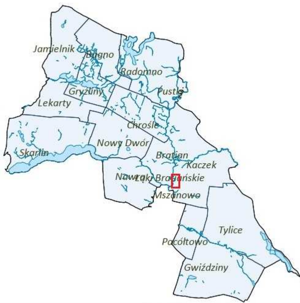
Rysunek 2. Orientacyjna lokalizacja obszaru objętego planem.

Źródło: opracowanie własne na podstawie: http://nml.intergis.pl/