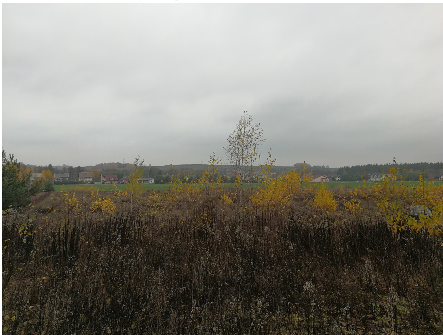
Zdjęcie 1. Roślinność na obszarze objętym planem.