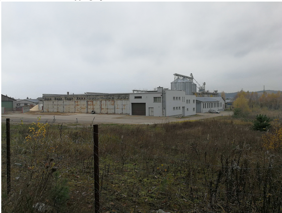
Zdjęcie 2. Sąsiedztwo obszaru objętego planem.

W najbliższym sąsiedztwie obszaru objętego planem, po stronie południowej, występuje zabudowa przemysłowa, natomiast po północnej stronie powstaje zabudowa mieszkaniowa jednorodzinna. Od wschodu występuje las.