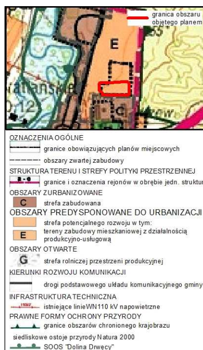
Rysunek 1. Wyrys ze Studium uwarunkowań i kierunków zagospodarowania przestrzennego gminy Nowe Miasto Lubawskie