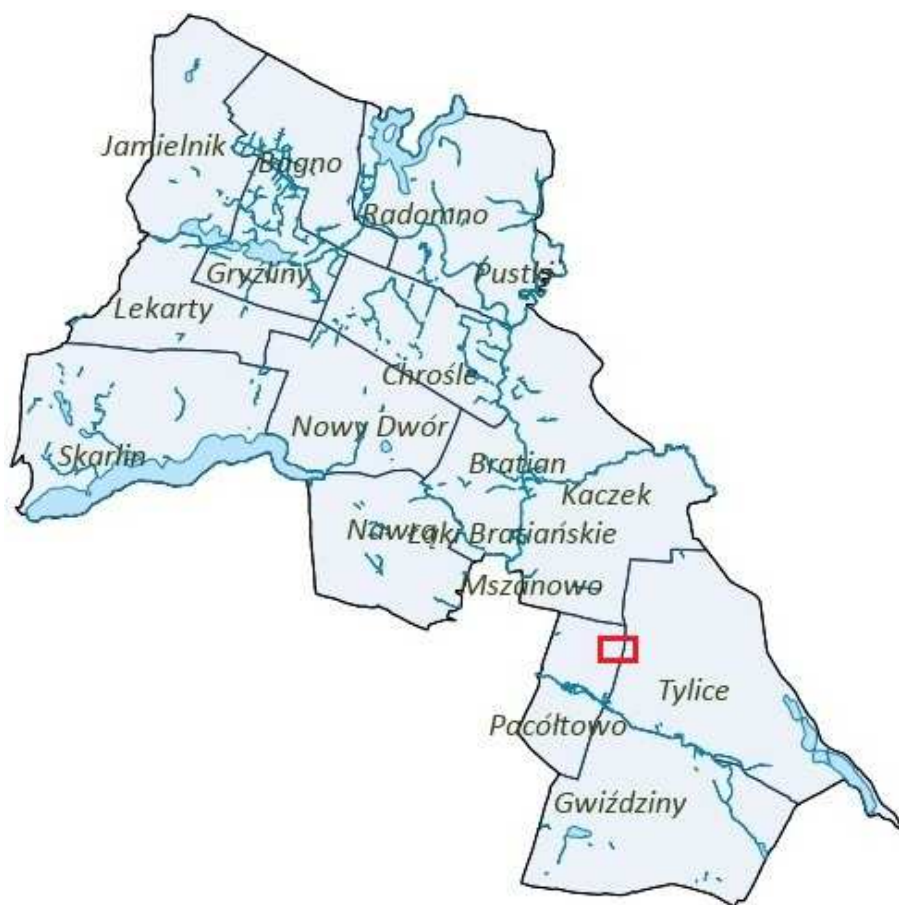
Rysunek 2. Orientacyjna lokalizacja obszaru objętego planem.