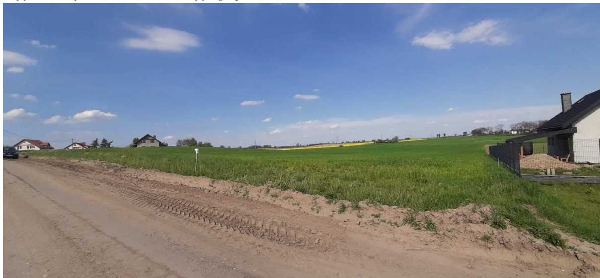
Zdjęcie 2. Sąsiedztwo obszaru objętego planem.

W rejonie obszaru opracowania dominuje krajobraz rolniczy, na który składają się tereny otwarte upraw rolnych oraz zabudowa zagrodowa i mieszkaniowa jednorodzinna. Jest to krajobraz słabo przekształcony. Istniejąca parcelacja działek oraz powstająca zabudowa mieszkaniowa jednorodzinna wskazują jednak na stopniowe odchodzenie od typowego rolniczego charakteru obszaru. W sąsiedztwie obszaru objętego planem powstaje obwodnica Nowego Miasta Lubawskiego.