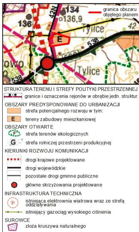
Rysunek 1. Wyrys ze Studium uwarunkowań i kierunków zagospodarowania przestrzennego gminy Nowe Miasto Lubawskie