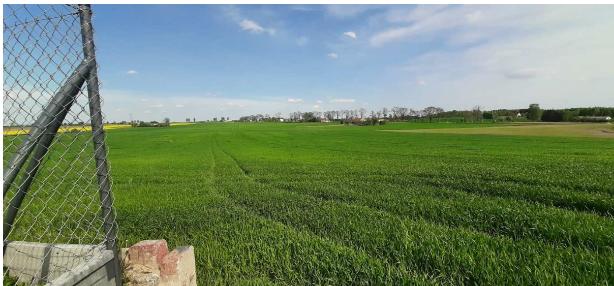
Zdjęcie 1. Roślinność na obszarze objętym planem.