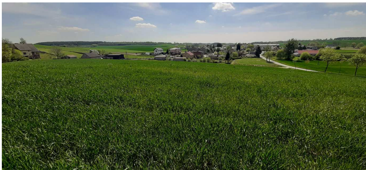
Zdjęcie 4. Sąsiedztwo obszaru objętego planem.