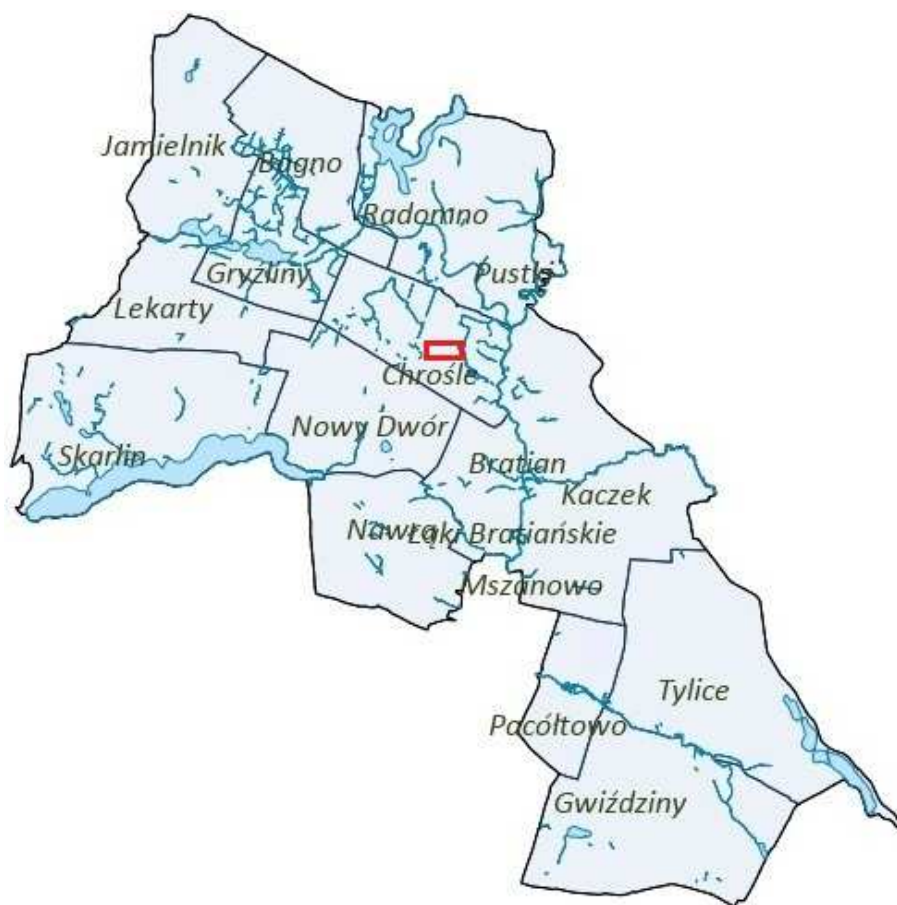
Rysunek 2. Orientacyjna lokalizacja obszaru objętego planem.