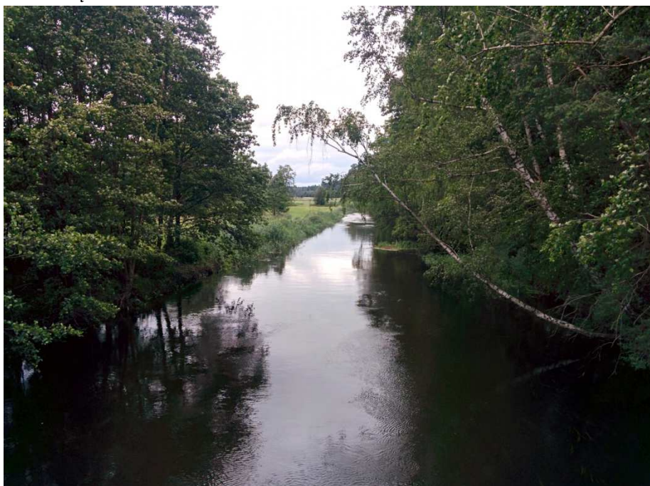
Zdjęcie 5. Rzeka Drwęża.

W odległości ok. 1,5 km na wschód od obszaru opracowania występuje największy w kraju rezerwat przyrody „Rzeka Drwęża”. Obejmuje swym zasięgiem Drwężę oraz niektóre z jej dopływów, m.in. fragment rzeki Wel wraz z jej 5 metrowym pasem przybrzeżnym. Zajmuje łączną powierzchnię 1248 ha. Celem ochrony jest zachowanie środowiska wodnego w niezmienionym stanie, a w szczególności ochrona ryb bytujących w tej rzece (pstrąga, łososia, troci wędrownej i certy). Na terenie rezerwatu zabrania się m.in.: nadmiernego zanieczyszczania wody, przegradzania rzek, połowu ryb urządzeniami stałymi, odłowu ryb, wycinania drzew, krzewów, trzciny, sitowia i innych roślin oraz koszenia traw.