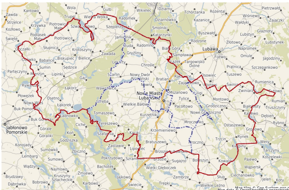
Rysunek 2: Powiat Nowomiejski wraz z przynależącymi do niego miejscowościami.