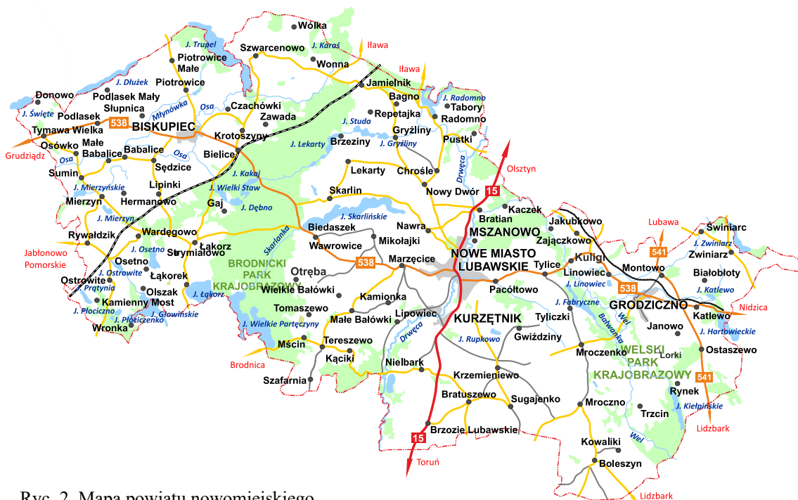
Ryc. 2. Mapa powiatu nowomiejskiego

Powiat ma charakter typowo rolniczy. Użytki rolne zajmują większą część powierzchni powiatu – blisko 70%. Lesistość powiatu jest niska, wynosi aktualnie ok. 22%. Grunty pokryte wodami ok. 3,2 %. Rzeźba terenu jest bardzo zróżnicowana, dominuje krajobraz pagórkowaty, poprzecinany dolinami rzecznyymi, rynnami i nieckami jezior, terenami podmokłymi. Sieć hydrograficzna jest bogata. Osią powiatu jest rzeka Drwęca, która jest najdłuższym (207 km) prawym dopływem Wisły w północnej Polsce. Inne ważne rzeki to Wel, Osa i Skarlanka. Zróżnicowanie i urozmaicenie, czyli bioróżnorodność, przyjmowane jest powszechnie za miernik wartości przyrodniczych i krajobrazowych. Pod tym względem walory przyrodnicze powiatu należy ocenić bardzo wysoko. Występuje wiele chronionych i rzadkich gatunków roślin, zwierząt i grzybów.