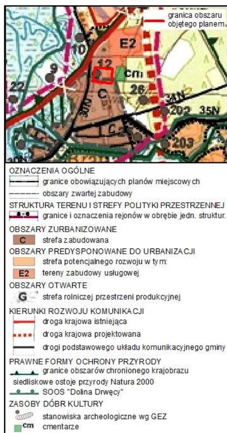
Rysunek 1. Wyrys ze Studium uwarunkowań i kierunków zagospodarowania przestrzennego gminy Nowe Miasto Lubawskie