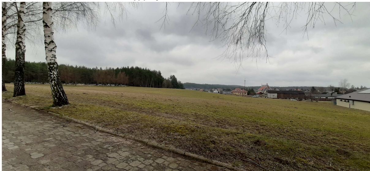
Zdjęcie 1. Roślinność na obszarze objętym planem.