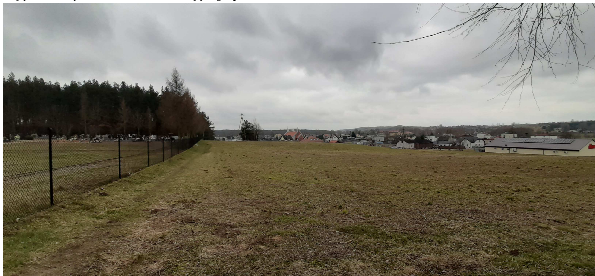
Zdjęcie 2. Sąsiedztwo obszaru objętego planem.

W sąsiedztwie obszaru opracowania występuje zwarta zabudowa miejscowości Bratian oraz usługi. Od wschodu obszar objęty planem graniczy z cmentarzem.