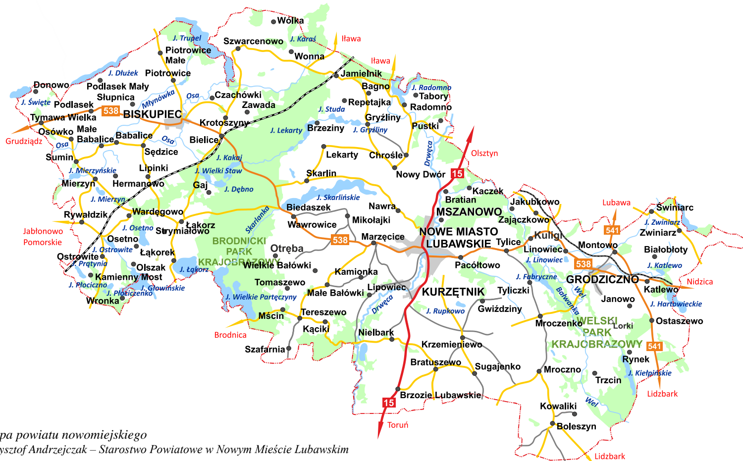
Ryc. 2. Mapa powiatu nowomiejskiego

Powiat ma charakter typowo rolniczy. Użytki rolne zajmują większą część powierzchni powiatu – blisko 70%. Lesistość powiatu jest niska, wynosi aktualnie ok. 22%. Grunty pokryte powodami ok. 3,2%. Rzeźba terenu jest bardzo zróżnicowana, dominuje krajobraz pagórkowaty, poprzecinany dolinami rzeczny, rynami i nieckami jezior, terenami podmokłymi. Sieć hydrograficzna jest bogata. Ośią powiatu jest rzeka Drwęca, która jest najdłuższym (207 km) prawym dopływem Wisły w północnej Polsce. Zróżnicowanie i urozmaicenie, czyli bioróżnorodność, przyjmowane jest powszechnie za miernik wartości przyrodniczych i krajobrazowych. Pod tym względem walory przyrodnicze powiatu należy ocenić bardzo wysoko. Występuje wiele chronionych i rzadkich gatunków roślin, zwierząt i grzybów.