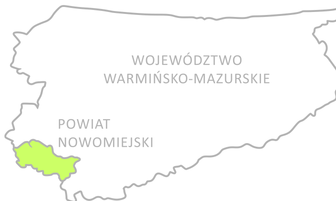
Ryc. 1. Powiat nowomiejski na tle województwa warmińsko-mazurskiego

Powiat nowomiejski położony jest w południowo – zachodniej części województwa warmińsko – mazurskiego i obejmuje miasto Nowe Miasto Lubawskie oraz cztery gminy wiejskie: Biskupiec, Grodziczno, Kurzętnik i Nowe Miasto Lubawskie.