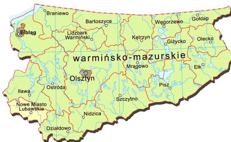
Rys. 1. Powiat nowomiejski na tle województwa warmińsko-mazurskiego

Obszar powiatu nowomiejskiego zajmuje powierzchnię 693,93 km 2 . Teren położony jest w południowo-zachodniej części województwa warmińsko-mazurskiego, obejmując zasadniczo trzy jednostki fizycznogeograficzne: Pojezierze Brodnickie, Dolina Drwęcy i Garb Lubawski. Północno-zachodnie fragmenty powiatu (obszar gminy Biskupiec) znajdują się w granicach Pojezierza Iławskiego, zaś wschodnie granice powiatu (gmina Grodziczno) stykają się z Równiną Urszulewską.