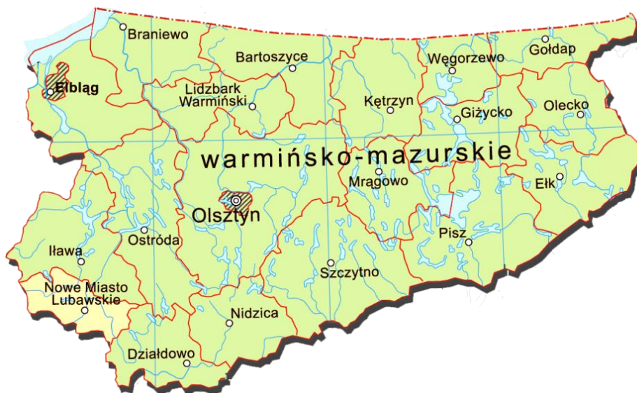
Tab. 3. Podstawowe informacje o Powiecie Nowomiejskim